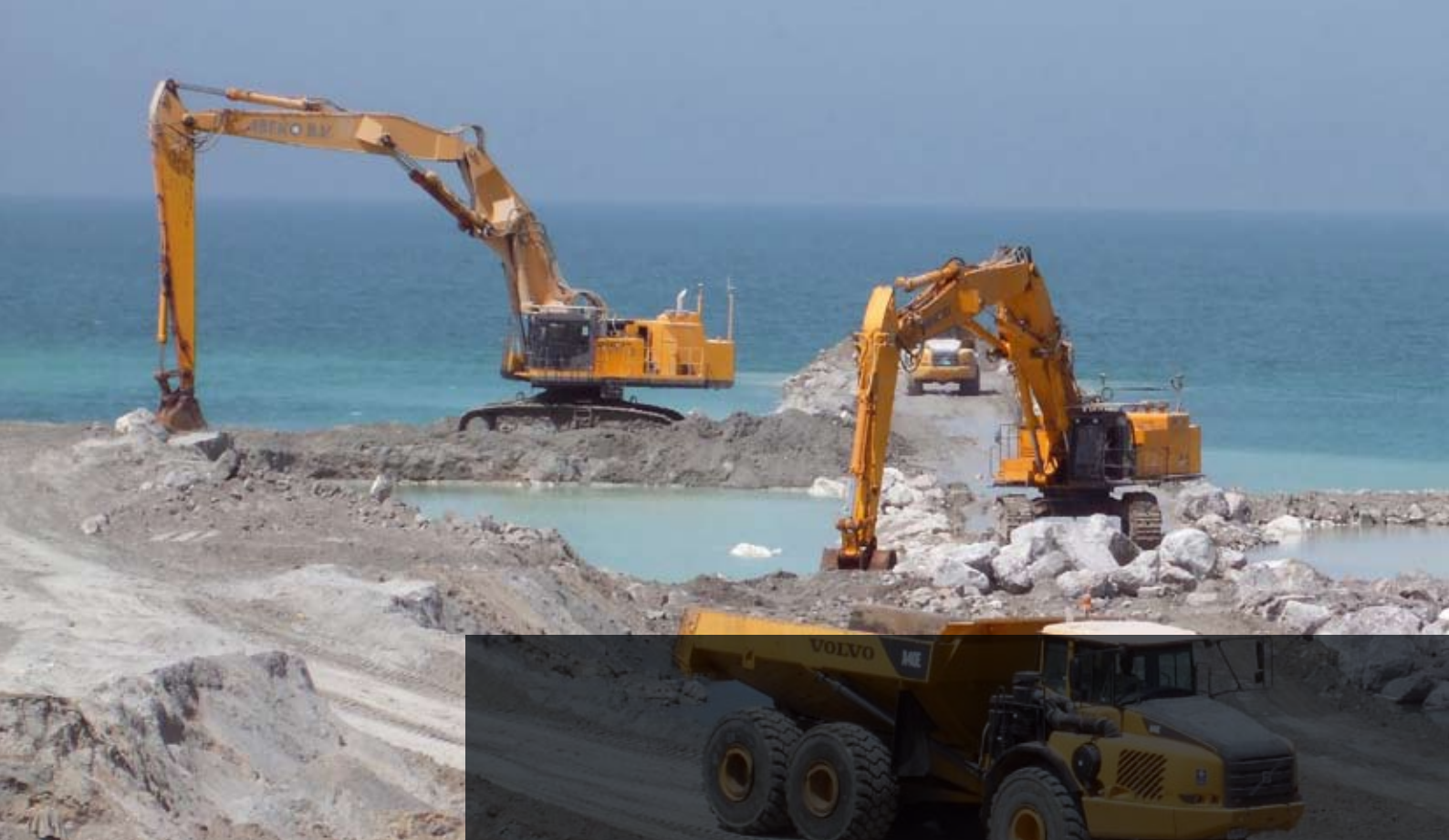
DEMOLICIÓN DE ROMPEOLAS VIEJO Y CONSTRUCCIÓN DE ROMPEOLAS NUEVO EN DUBAI (UAE)