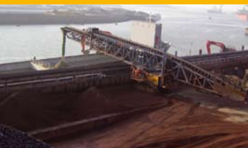
CINTA TRANSPORTADORA MÓVIL DE 65 METROS SOBRE ORUGAS PARA EL TRANS- BORDO DE MINERALES EN LA ACERÍA DE IJMUIDEN CON UNA CAPACIDAD DE 3000 TONELADAS POR HORA