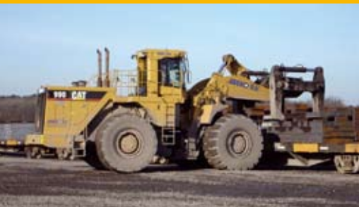
CATERPILLAR 990 TEN BEHOEVE VAN PLAKKENTRANSPORT BIJ STAALFABRIEK IN IJMUIDEN